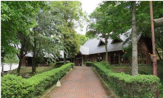
外観① 食堂・宿泊エリアへのアプローチ