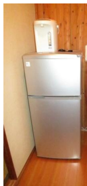
宿泊室の冷蔵庫 冷凍 29L 冷蔵 80L